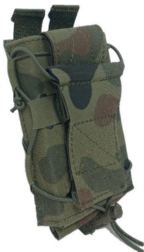
19. Ładownica pojedyncza karabinowa