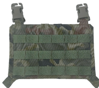
2. Panel szturmovy