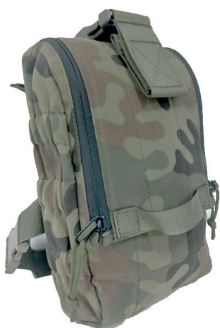
17. Zasobnik na maskę przeciwigazową