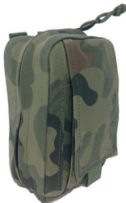
15. Zasobnik cargo