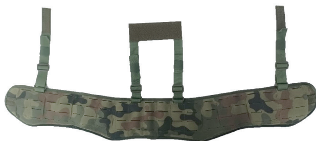
3. Rękaw modułowy na pas