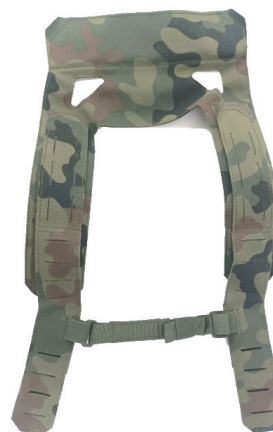
4. Szelki uniwersalne