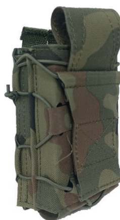
18. Ładownica podwójna karabinowa