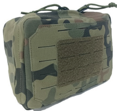
16. Zasobnik cargo duże