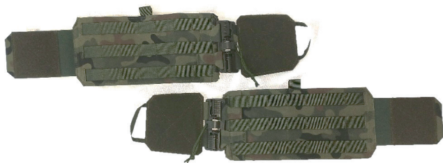
1. Pas boczny „cummerbund”