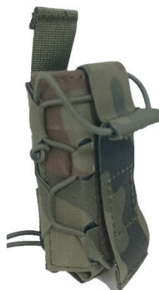
20. Ładownica pojedyncza pistoletowa